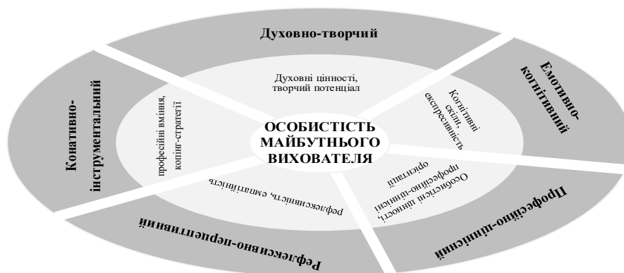
Рис. 1. Компоненти та конструкти в структурі професійної культури майбутніх вихователів ЗДО

Таким чином, наша концептуальна парадигма спрямована на теоретичне обґрунтування та розвиток основ професійної культури майбутніх вихователів закладів дошкільної освіти, а саме – життєтворчого потенціалу, професійної компетентності, духовно-ціннісних орієнтацій . Цей процес буде здійснюватися згідно з визначеними нами етапами (докомпетентнісний, адаптаційний, цілепокладання, компетентнісний, творчий), в межах акме-аксіологічного підходу, із урахуванням розроблених нами вихідних положень (принципів активної креативності, суб'єктності, трансцендентності), шляхом актуалізації соціально-психологічних умов (духовно-акмеологічних, змістово-інструментальних, організаційно-виробничих) та активізації внутрішніх (індивідуально-психологічних і суб'єктних) і зовнішніх (освітніх, соціальних та соціокультурних) чинників. Всебічний аналіз підходів до складових професійної культури майбутніх фахівців дозволив нам обґрунтувати структуру професійної культури майбутніх вихователів ЗДО, до якої включено: компоненти, їхні конструкти, критерії та якісні показники до них.