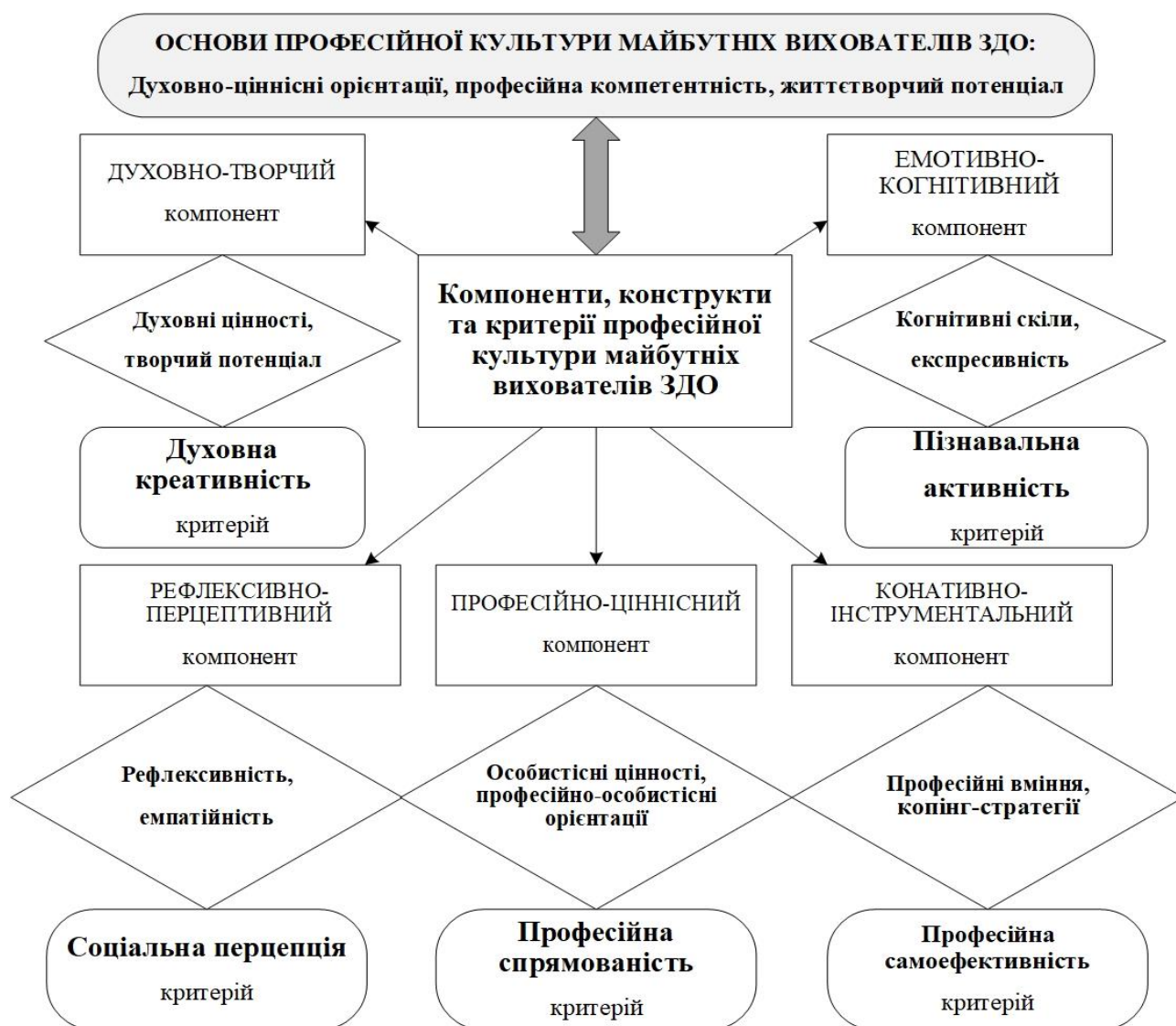
Рис. 2. Структура розвитку професійної культури майбутніх вихователів ЗДО

включає інтелектуальний та духовно-творчий потенціал особистості здобувача освіти, визначає його світоглядні уявлення, ціннісні орієнтації та загальну концепцію життєздійснення на гуманістичних засадах та трансцендентних цінностях.